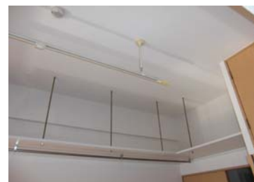
↑天井高を利用した収納スペース